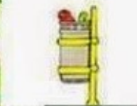
il cestino dei rifiuti