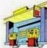
la stazione di servizio