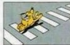
le strisce pedonali